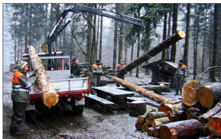
Angehörige der ZSO Jungfrau region üben am Rugen, wie mit Seilzugapparaten schwere Lasten verschoben werden können.

gangenen Woche mussten die zwei Formationen Bödeli 1 und Bödeli 2 zu diesem Zweck im Rugen oberhalb Interlaken schwere Lasten heben und verschieben, Holz bearbeiten und Sicherheitsüberlegungen anstellen. «Das korrekte Beurteilen einer Situation und das Sammeln von Erfahrungen zum Schutz vor Selbstunfällen waren die Hauptlernziele bei den Anwendungen der Motorsäge», informiert die ZSO weiter. Die Übungen kommen der Bevölkerung zugute: Im Rahmen des Einsatzes wurden alte Einrichtungen am Grillplatz beim Chlousbrunne erneuert und zusätzliche Sitzgelegenheiten im Rugen geschaffen. Nach der Übung wurde der neue «Brätliplatz» eingeweiht. PD