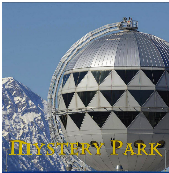
Das Wahrzeichen des Mystery Park in Interlaken.